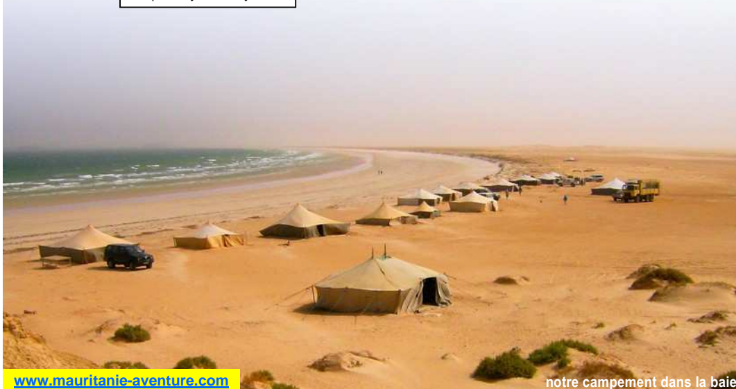
notre campement dans la baie

correspond au jour 18 du programme «Aventure entre désert, oasis et océan»