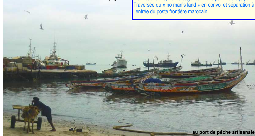
au port de pêche artisanale

http://www.mauritanie-aventure.com/fichiers/programme_20_jours.pdf en page 28