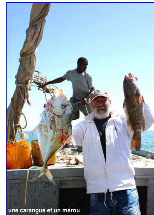
une carangue et un méro

http://www.mauritanie-aventure.com/fichiers/programme_20_jours.pdf en page 22