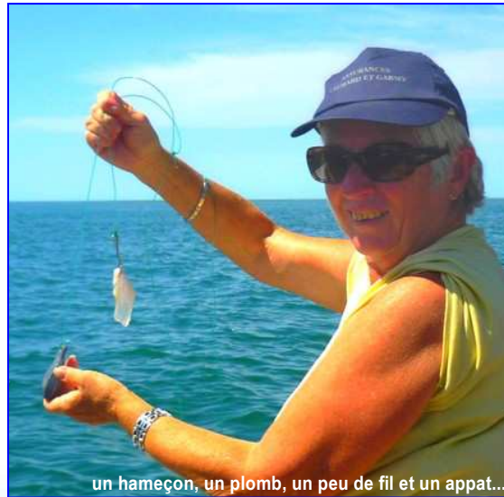
un hameçon, un plomb, un peu de fil et un appât...