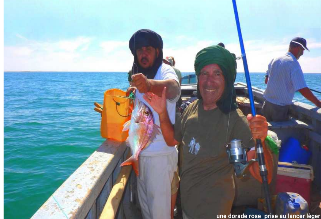
une dorade rose prise au lancer léger