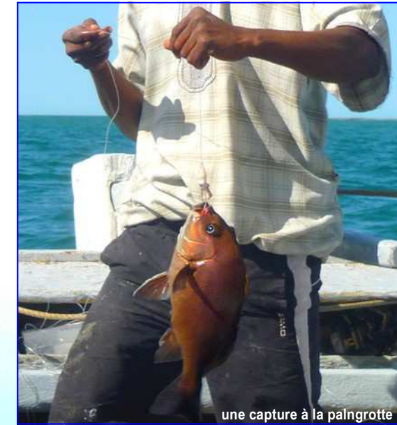
une capture à la palngrotte

Accompagnement en convoi pour rejoindre la route goudronnée, hors piste sur un désert parfaitement plat et porteur, sans aucun risque pour les véhicules. Sur la route goudronnée, parcours libre puis regroupement à Boulanoir. Halte dans l'ancien caravansérial de Boulanoir, pause déjeuner et moment détente, possibilité de lessive. Départ pour la presqu'île de Nouadhibou. Camp de Base en bord de mer à Nouadhibou. Nuit au Camp de Base.