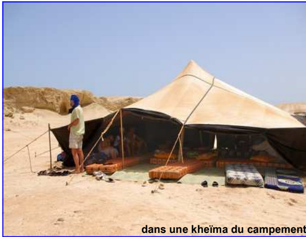
dans une kheïma du campement