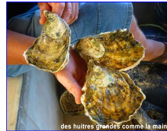
des huitres grandes comme la main

Dans les roches de la baie vous pourrez ramasser des moules tout aussi géantes.